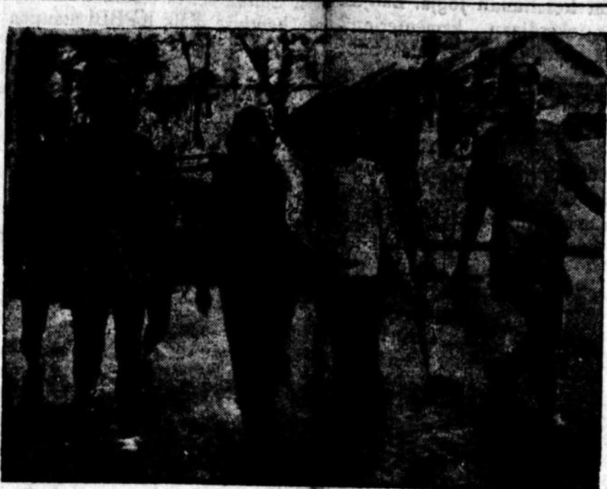
Pada gambar diatas kelihatan dua orang wanita Vietnam sedang di giring oleh polisi Perantjis kemahkamah militer di Saigon. Kedua mereka ini dituduh melakukan perbuatan teror. Rupanja dalam golongan Vietnam wanitanya turut ambil bagian.

Wakil Filipina ini menguntji pidato tersebut dalam pertemuan tahunan dari Kantor Perniagaan dari Brooklyn: pidato